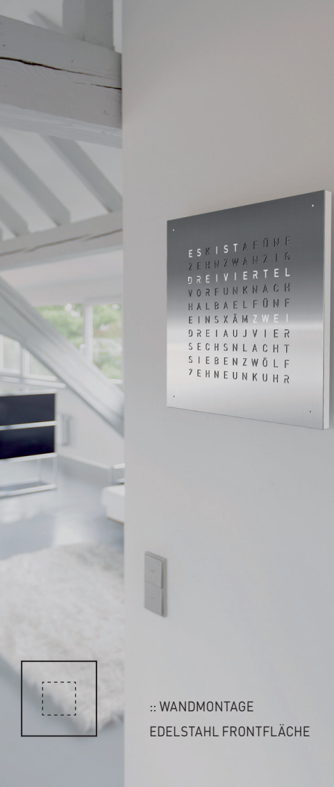
WANDMONTAGE EDELSTAHL FRONTFLÄCHE

QLOCKTWO :: DIE ZEIT IN ZEITLOSEM DESIGN. OHNE ZEIGER. OHNE ZIFFERN.