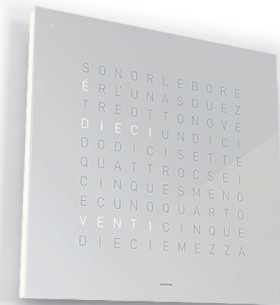
10:23 :: ITALIENISCH :: VANILLA SUGAR