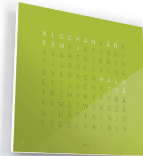
13:25 :: SCHWEDISCH :: LIME JUICE