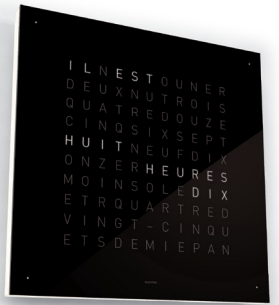
8:10 :: FRANZÖSISCH :: BLACK ICE TEA

DIE FRONTFLÄCHE DER QLOCKTWO WIRD VON ACHT MAGNETEN GETRAGEN. AUF DIESE WEISE KANN SIE OHNE SICHTBARE BEFESTIGUNGEN GEWECHSELT WERDEN. GEBÜRSTETES EDELSTAHL ODER FÜNF FARBEN AUS POLIERTEM SYNTHETISCHEN GLAS STEHEN ZUR AUSWAHL