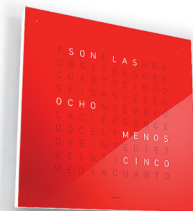
08:56 :: SPANISCH :: CHERRY CAKE

AN DER WAND SCHWEBT EIN PERFEKTES QUADRAT. EINE MATRIX MIT SYMMETRISCH ANGEORDNETEN SCHRIFT- ZEICHEN BILDET IM INNEREN EIN WEITERES QUADRAT. EINIGE DIESER ZEICHEN LEUCHTEN IN REINEM WEISS UND FORMEN SO WORTE, DIE DIE ZEIT BESCHREIBEN.