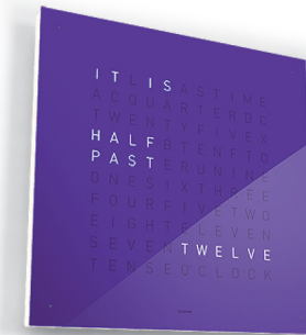
12:30 :: ENGLISCH :: FROZEN BLACKBERRY